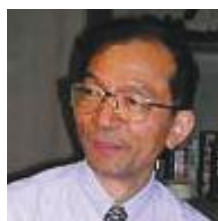
前沢 政次 北海道大学 医学部教授